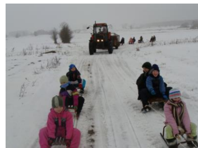
Pędzą, pędzą sanie