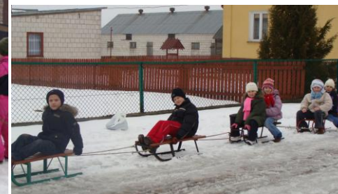
wracamy do szkoły