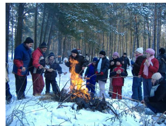
ognisko i pieczenie kiełbaski