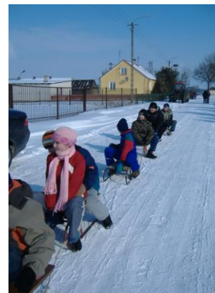
Sanna była wyśmienita

We czwartek 19.02 zorganizowaliśmy kulig po przepięknej i ośnieżonej okolicy Boguszeza. Pogoda była bajkowa - niezbyt zimno, słońce pięknie świeciło i mnóstwo białego puchu na drodze. Punktem kulminacyjnym kuligu było ognisko i pieczenie kiełbasek. W przerwie wspaniała zabawa na śniegu. Zjeżdżanie z górki, zabawa w śnieżki, wyścigi między drzewami - no i śpiew przy ognisku. A potem... pędzanie sanie po zaśnieżonych drogach, słyhać śpiew, okrzyki. Roześmiane twarze uczestników mówią, że kulig był udany.