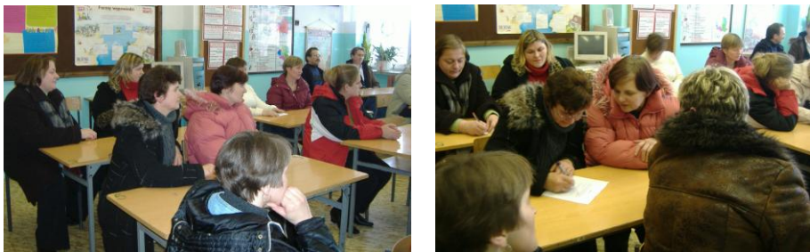
Rodzice podczas zebrania

Zakończyliśmy naukę I półrocza, jesteśmy na półmetku. Czas na małe podsumowania. We środę miało miejsce spotkanie rodziców na którym dowiedzieli się o postępach w nauce swoich pociech. Czas więc na zasłużony odpoczynek. FERIEEEEEEEEE!!! HURAAAAAAAAAAAAAA Wykorzystajmy je z głową.