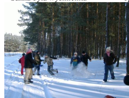
Zabawy na śniegu